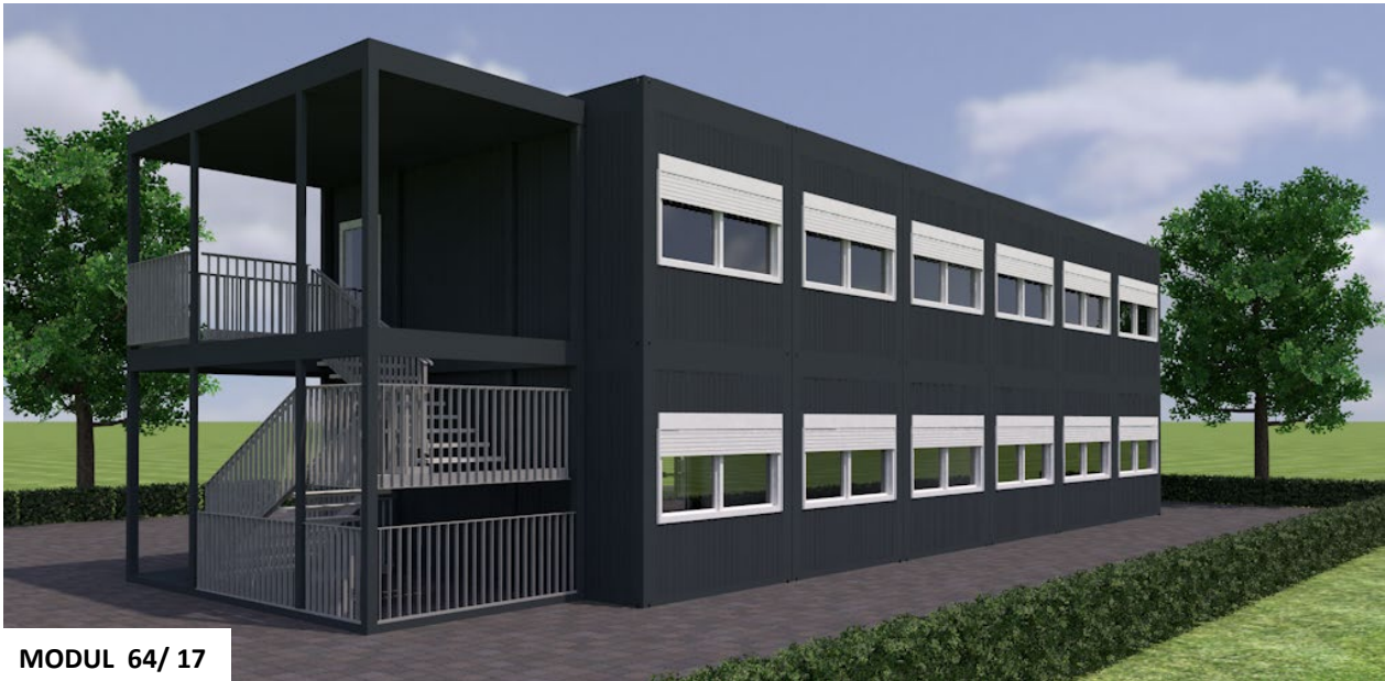
MODUL 64/ 17

Gebäudefläche Verfügbar ab Neupreis Kauf