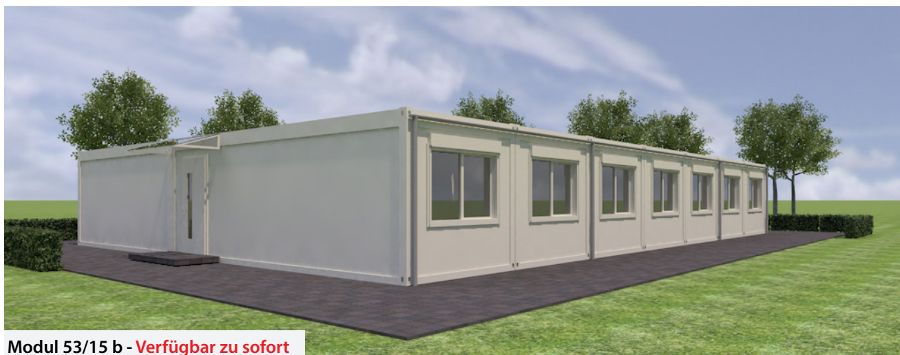
Modul 53/15 b - Verfügbar zu sofort

flexibel einsetzbar als Unterkunfts-, Büro- oder Verwaltungsgebäude