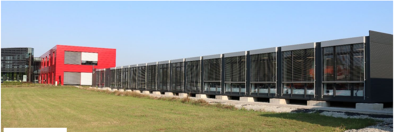
MODUL 33/ 18

Gebäudefläche Verfügbar ab Neupreis Kauf